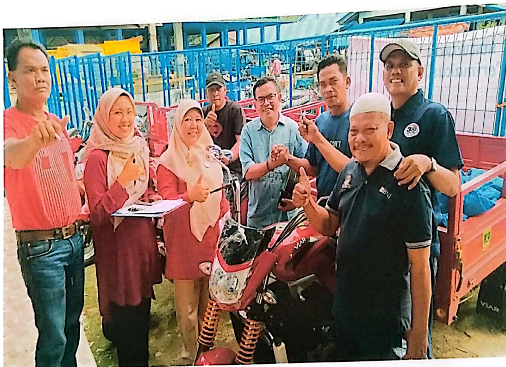
Penyerahan SPG Roda Tiga di Kab. Pesisir Selatan