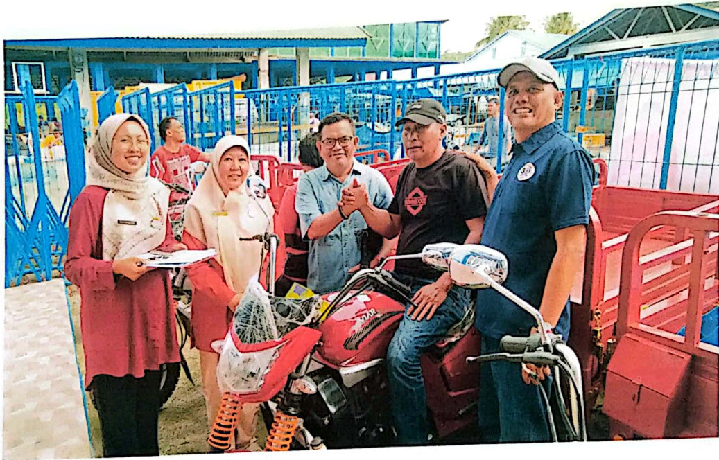
Penyerahan SPG Roda Tiga di Kabupaten Pasaman Barat