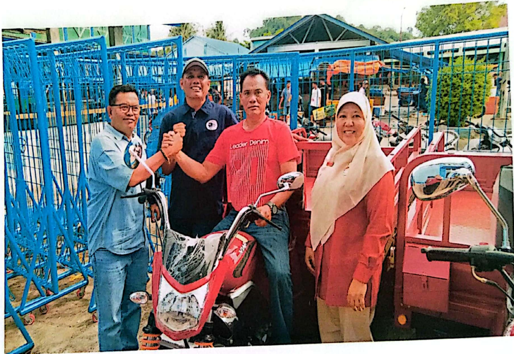
Penyerahan SPG Roda Tiga di Kabupaten Pasaman Barat