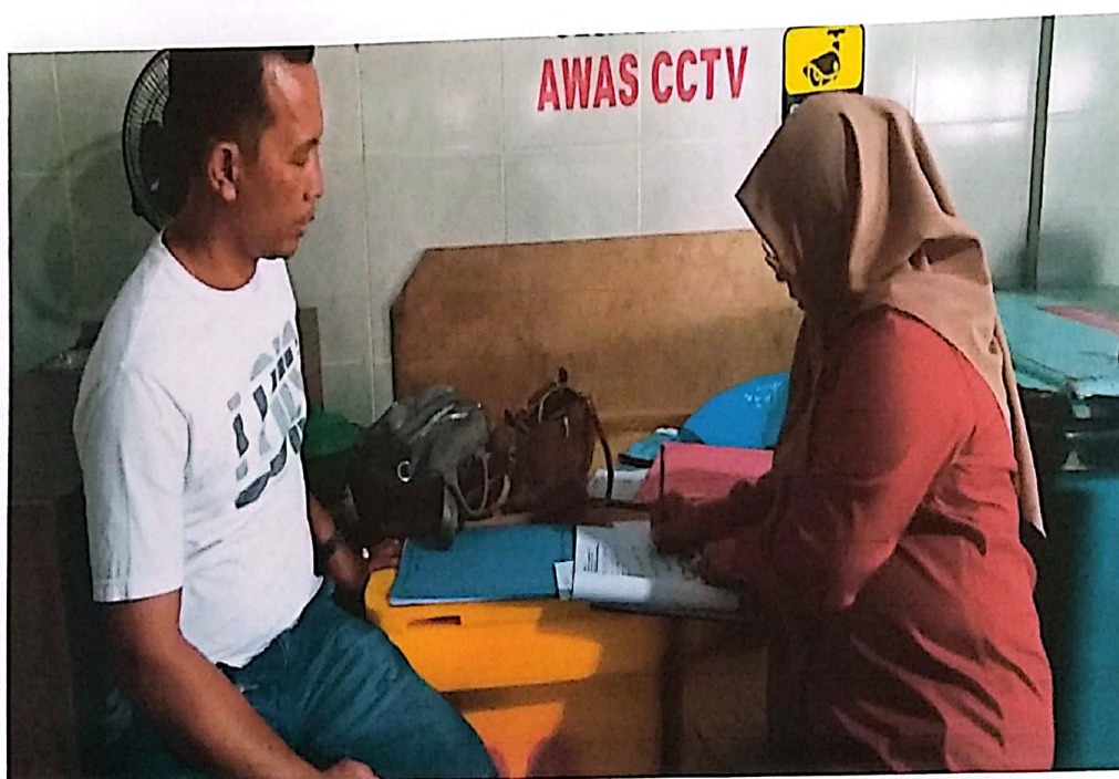
Verifikasi SPG Roda Tiga di Kab. Pesisir Selatan