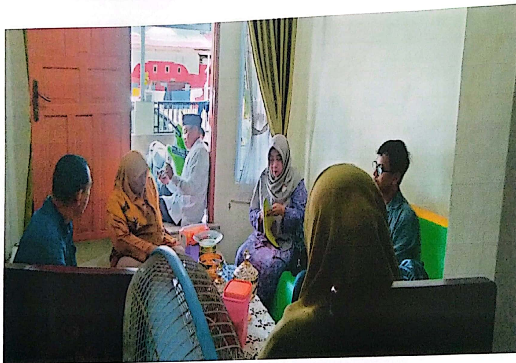
Verifikasi SPG Roda Tiga Kab. Kep. Mentawai