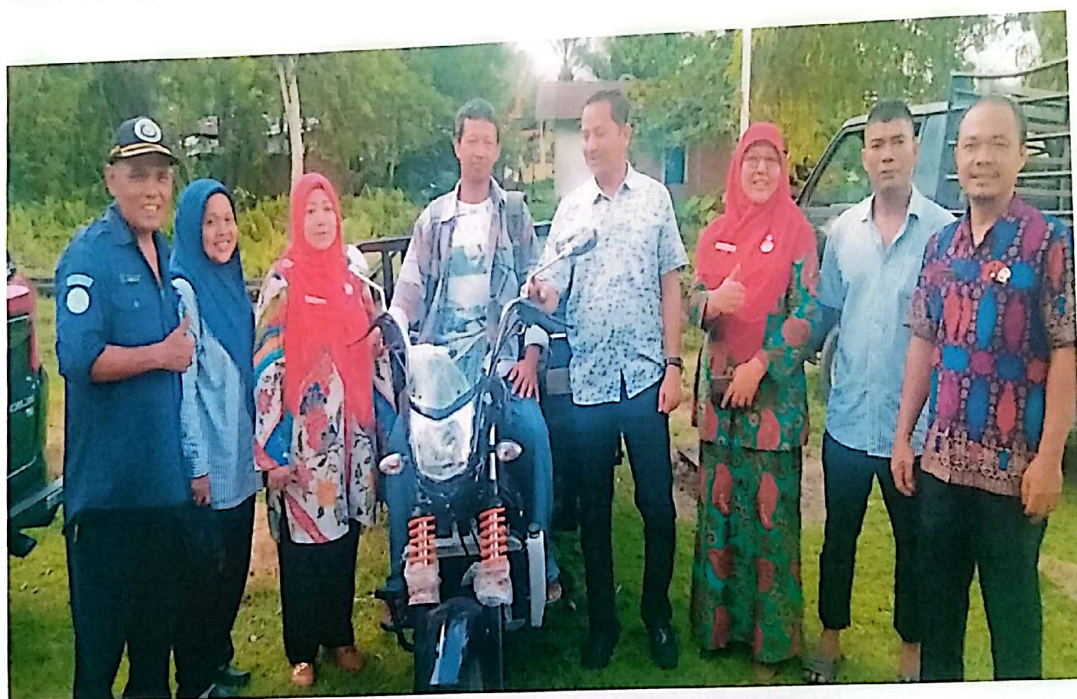
Penyerahan SPG Roda Tiga di Kab. Agam