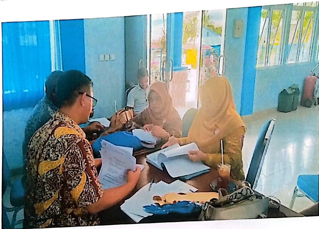
Verifikasi SPG Roda Tiga di Kab. Pasaman Barat