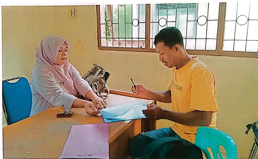
Verifikasi SPG Roda Tiga di Kab. Agam