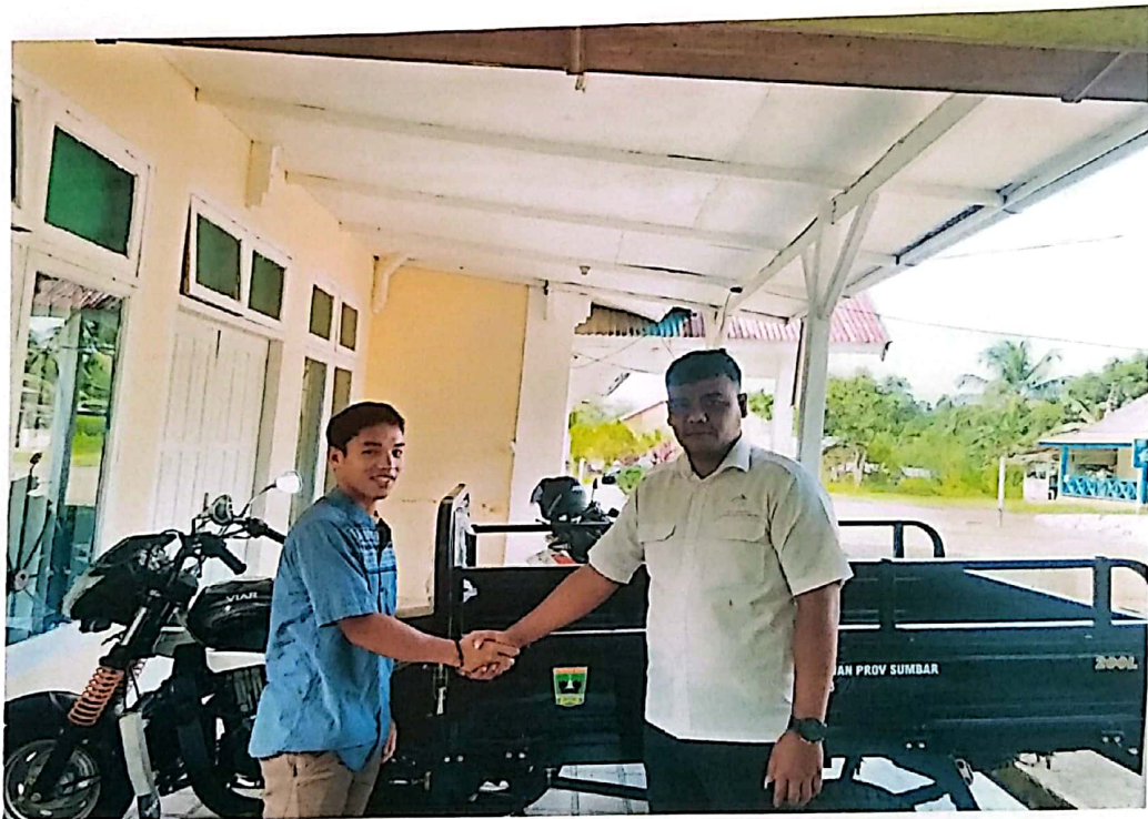
Penyerahan SPG Roda Tiga di Kab. Kepulauan Mentawai