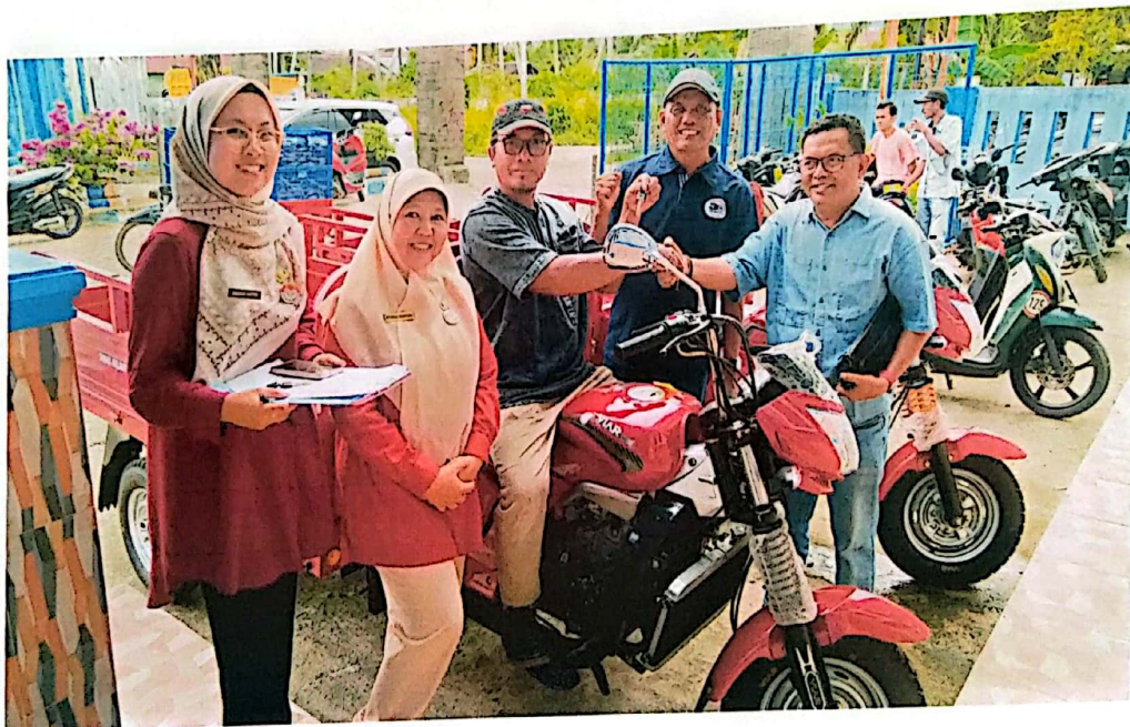
Penyerahan SPG Roda Tiga di Kabupaten Pasaman Barat